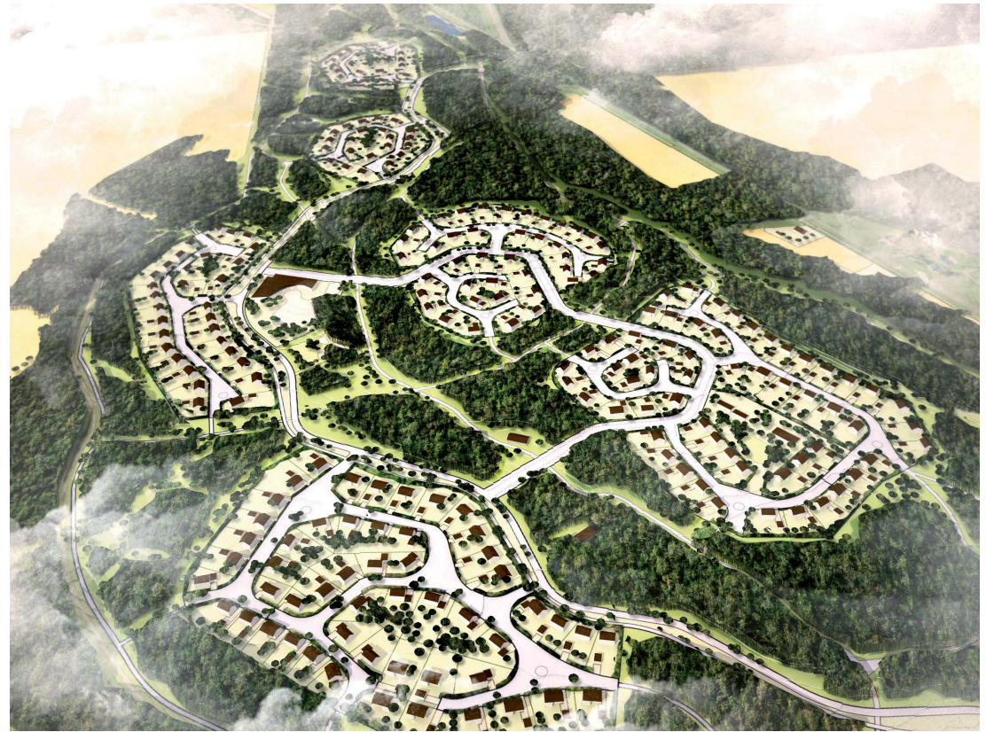
Vasemmalla osayleiskaavaehdotus. Yllä osayleiskaava-alue etelästä nähtynä. Alla alueella tyypillistä harjumaismaa.